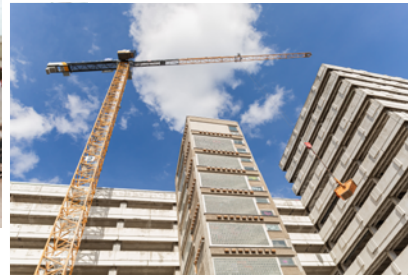
Haus der Statistik