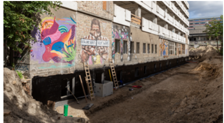
Haus der Statistik

In der Hochschule erhalten Sie Kenntnisse in: